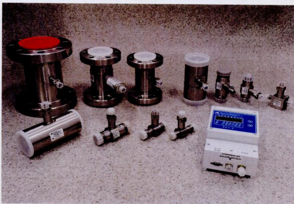
Рисунок 2 - Общий вид преобразователей